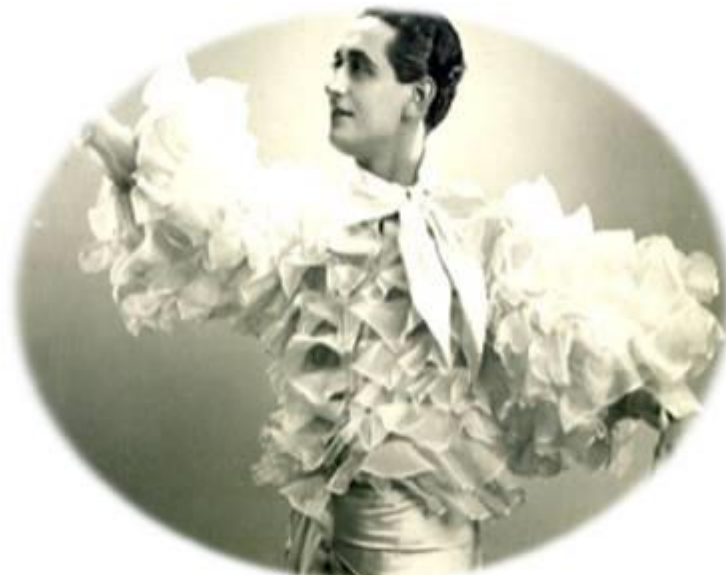
Miguel de Molina

Pero sobre todo se estableció una aproximación a la fascinante personalidad de alguien tan polifacético que renovó el mundo del espectáculo musical, diseñador, coreógrafo, arreglista y empresario de sus propios espectáculos. Trabajador incansable. El hombre de las mangas de farol. El de las camisas de lunares. Pocos fueron tan eclécticos y originales. Aquel que vivió y sigue viviendo en sus interpretaciones. Miguel de Molina.