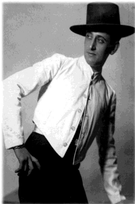
Miguel de Molina

Los primeros pasos de Miguel de Molina tendrían lugar en un corral de vecinos malagueño, en el que el pequeño artista, consciente de las necesidades familiares, dio tempranas muestras de su originalidad y supervivencia: “Para ayudar a su madre, Miguel deja el colegio y acepta cualquier trabajo, hasta conseguir uno de repartidor de telegramas. Un día, lleva uno al gran poeta Salvador Rueda (...). Allí encuentra unos versos del que será después su admirado Federico García Lorca” 6 .