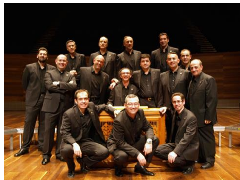
Schola Antiqua

Sí, es la conditio sine qua non . Para pertenecer al grupo es fundamental haber formado parte de la Escolanía del Valle. Esto nos asegura, en primer lugar, una lectura musical buena y un buen oído; además, no hay que enseñarles nada, porque también conocen la liturgia; y, en última instancia, hay una misma escuela de impostación de voz, que esto también es interesante. De hecho, ahora tenemos gente que quiere entrar; pero es complicado, sobre todo por los viajes. Hay algunos chicos que han entrado y están un año de prácticas, vienen a ensayar, practican todo, aunque no cantan en los conciertos, y luego a partir de ese año se integran completamente. Claro, si se quiere pensar en la supervivencia del grupo hay que renovarse, porque hay gente ya mayor. Son muchos años ya y se nota cómo, desde los primeros discos hasta ahora, el brillo de la voz ya no es el mismo.