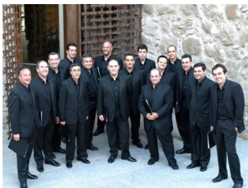
Schola Antiqua

En principio tenemos esos dos proyectos. Luego tenemos la celebración de los quinientos años de la muerte del Cardenal Cisneros . Queríamos grabar este año y que salgan al año que viene parte de los cantorales de Cisneros; que son los libros corales con liturgia mozárabe que se guardan en la Catedral de Toledo, sobre los que hasta ahora ha habido muy pocas grabaciones... Nosotros hemos hecho mucha música, hemos cantado muchísimo, pero nunca lo hemos grabado. También seguramente daremos un concierto con el Ensemble Plus Ultra o La Grande Chapelle , y cada vez que damos un concierto con ellos luego se graban; con lo cual, es casi seguro que grabaremos después del concierto que tenemos el 6 de junio en la Catedral de Toledo, con programa a confirmar.